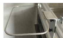
Support équerre avec système d'accroche horizontal et vertical (E+ / Maxi)