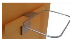
Support équerre pour chariot modulaire (E+ / Maxi)