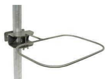
Support chariot rotatif fil inox