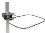
Support chariot rotatif fil inox